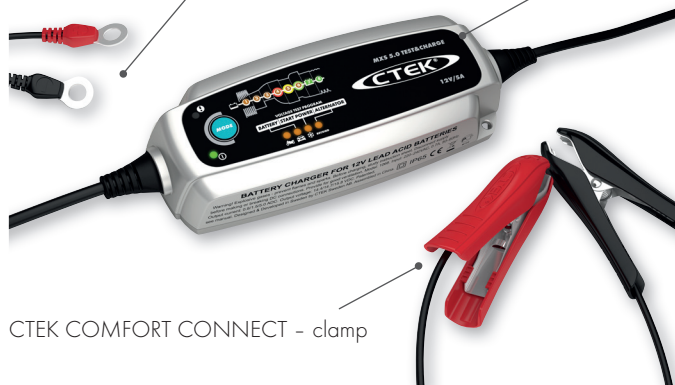
CTEK COMFORT CONNECT - clamp

Compleet accuonderhoud - uniek, gepatenteerd systeem voor het reconditioneren, opladen en onderhouden van alle soorten loodzuuraccu's om de prestaties en de levensduur te maximaliseren.